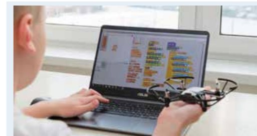
Leermiddelen voor innovatief onderwijs