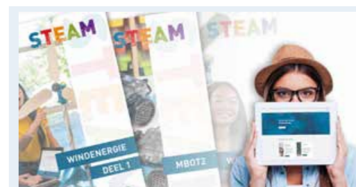
Lesmateriaal voor zelfstandig aanleren technologiewijsheid en 21 e eeuwse vaardigheden